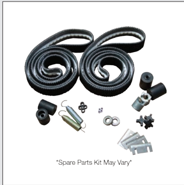
Kit de piezas de repuesto