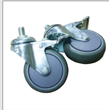
Ruedas con bloqueo