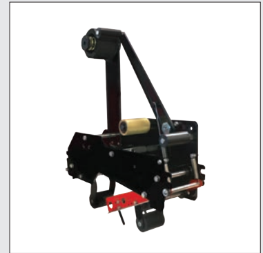
Cabezal de cinta de repuesto