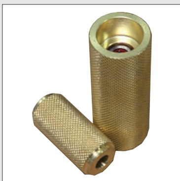
Rodillos estriados de bronce