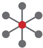
Diseño angosto universal