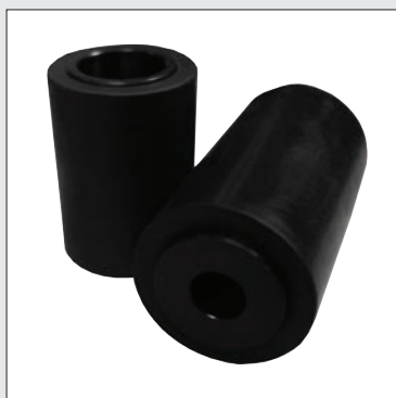
Rodillos de goma frontal y posterior