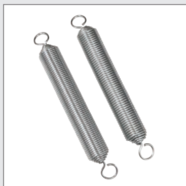
Resortes superior e inferior