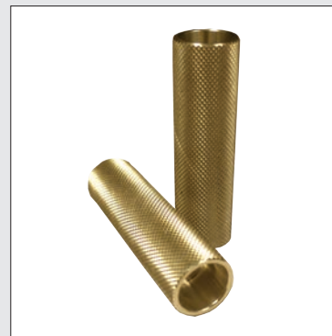
Rodillos de bronce

*Cuchillas de 2 y 3 pulgadas disponibles