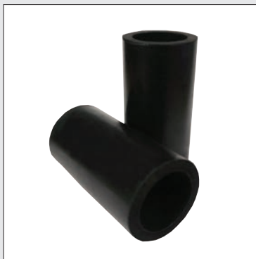
Rodillos de goma