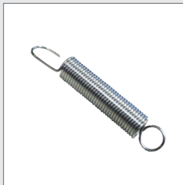
Resorte de soporte