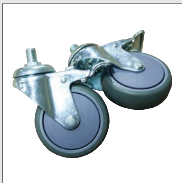
Ruedas con bloqueo