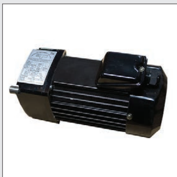
Mejora a motor de alta velocidad (Hasta 38m por min.)