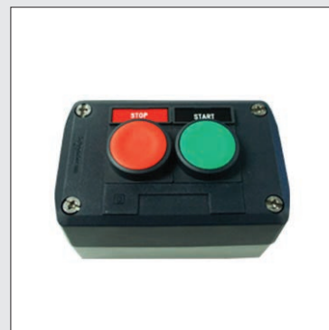
Interruptor de encendido y apagado