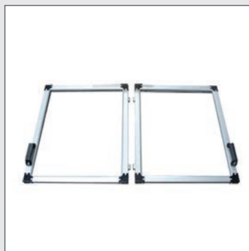
Puertas Interlock personalizadas (Pedido especial)